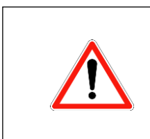
panneau de danger